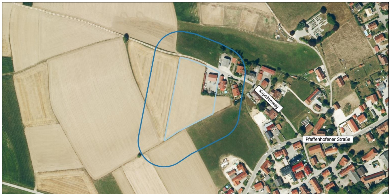
Abbildung 1: Das Auswertungsgebiet im aktuellen Orthophoto